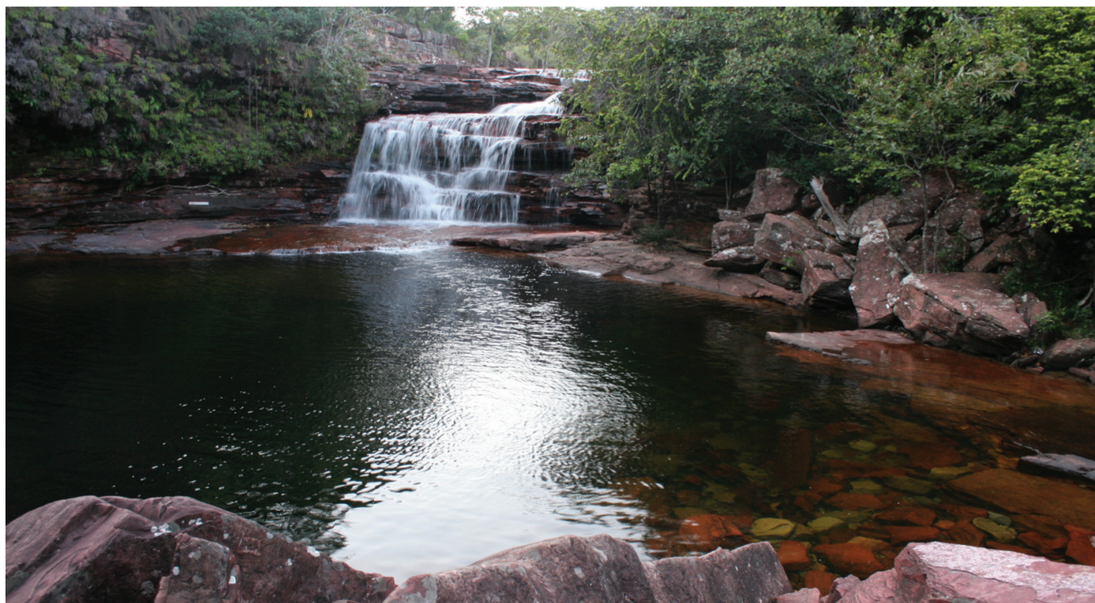
Río de Aguas Negras Parque Nacional Canaima