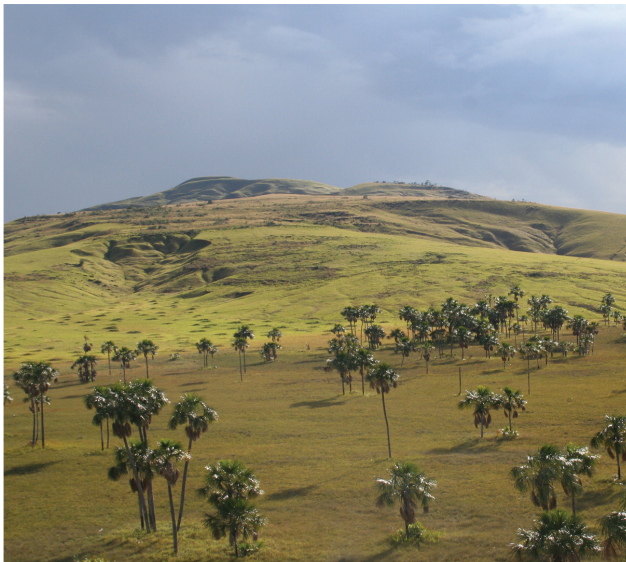
Moriches en la Gran Sabana