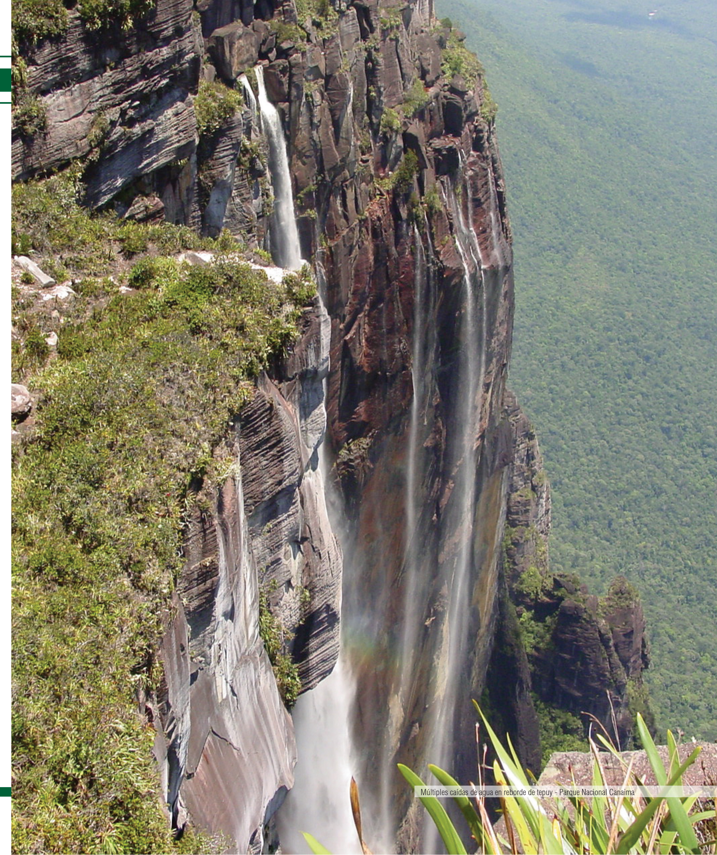
Múltiples caídas de agua en reborde de tepuy - Parque Nacional Canaima