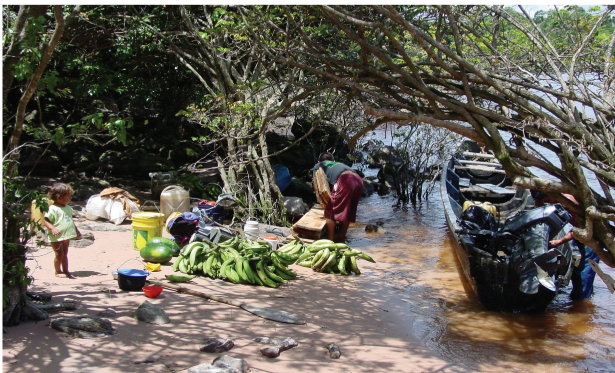
Familia Pemón río Carrao

Los Pemón han sido tradicionalmente horticultores y utilizan el sistema de conuco para sus cultivos. También se dedican a la caza, la pesca y la cría de animales domésticos. Sin embargo, como consecuencia de la actividad minera y el turismo que ocurren en las zonas tradicionales y aledañas de su ubicación, este grupo ha va-