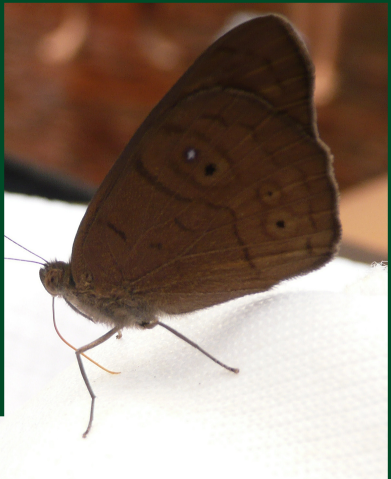
Diversidad de fauna, invertebrados y vertebrados del Parque Nacional Canaima