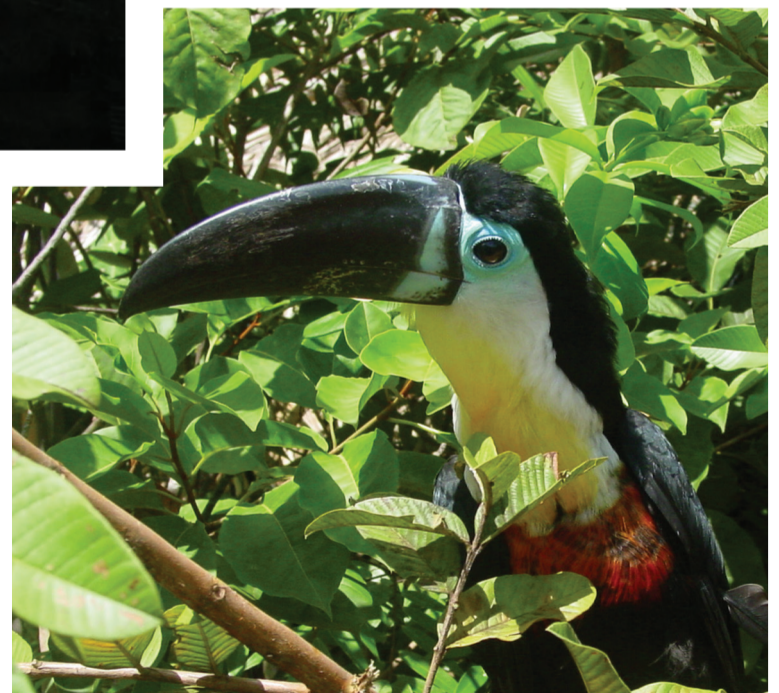
Gran variedad de Avifauna del parque