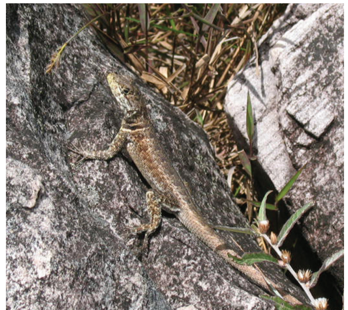
Fauna del parque