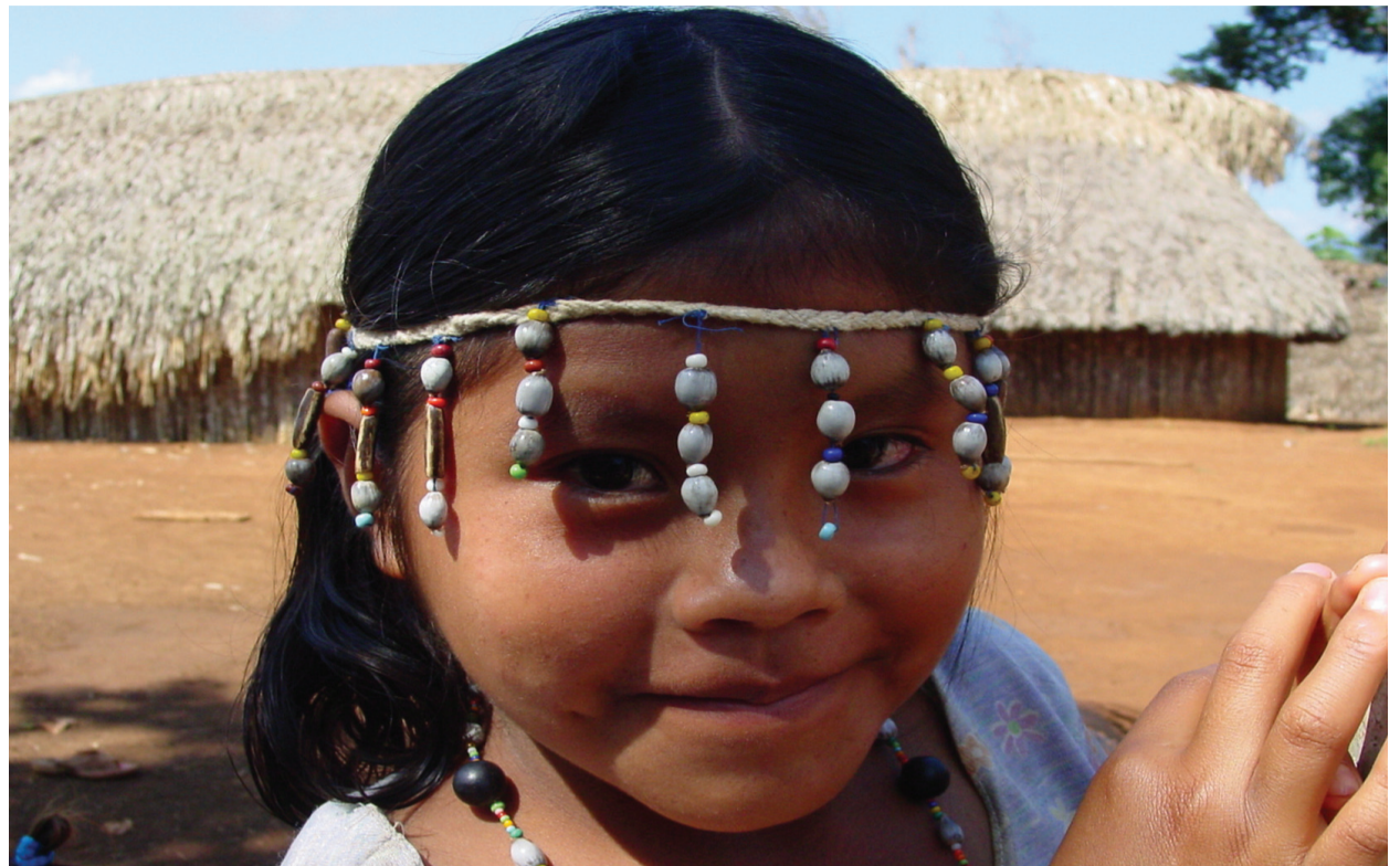
Niña Pemón con artesanía