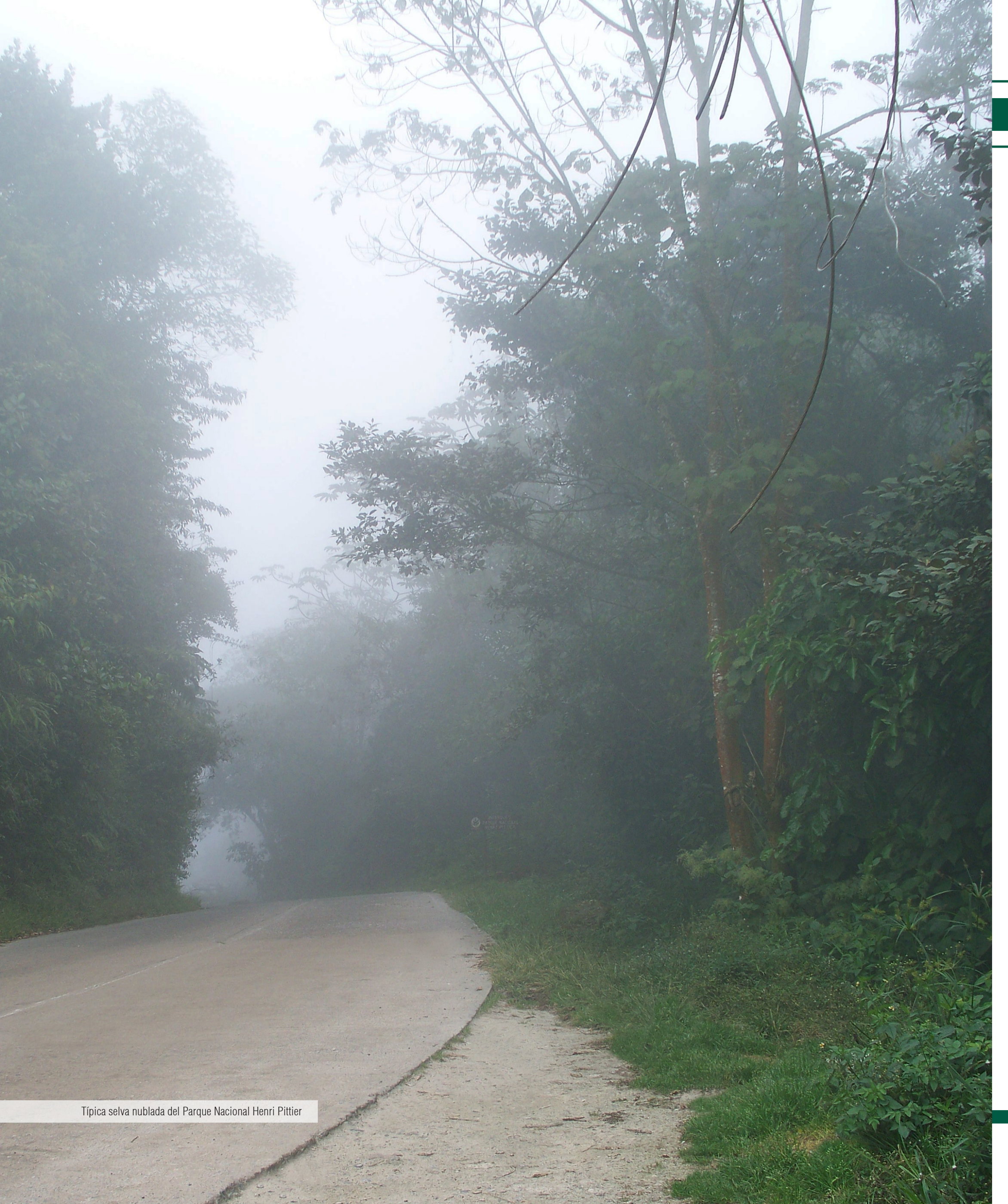
Típica selva nublada del Parque Nacional Henri Pittier