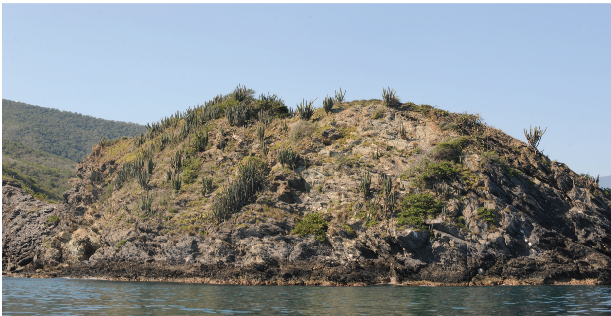
Vegetación xerofítica del litoral

La selva nublada comienza a desarrollarse en el frente norte a partir de los 820 y 850 m.s.n.m., aproximadamente.