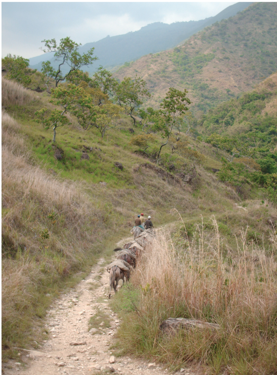
Típica cubierta vegetal de la parte baja de la vertiente sur del Parque Nacional Henri Pittier

En la alta montaña destaca la presencia de la selva nublada y selva superior producto de una humedad relativa muy alta sobre los 1.000 m.s.n.m.