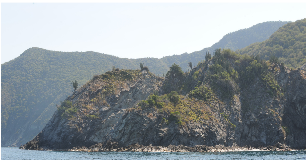
Bosque y vegetación xerofítica del sector litoral