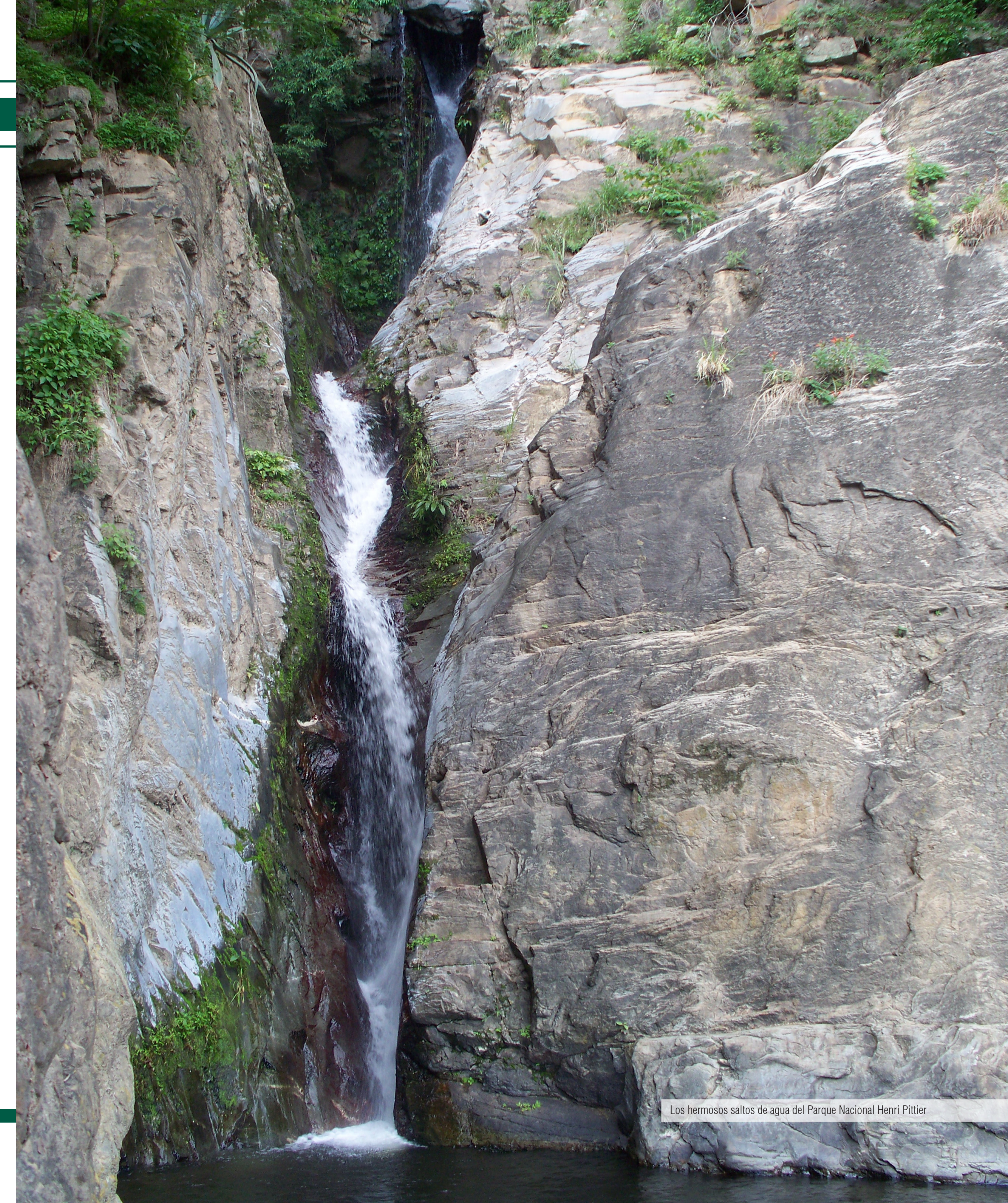
Los hermosos saltos de agua del Parque Nacional Henri Pittier