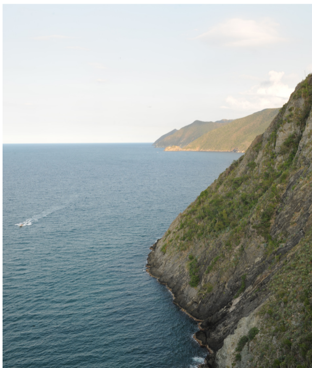
La vertiente cae a pico en el sector litoral