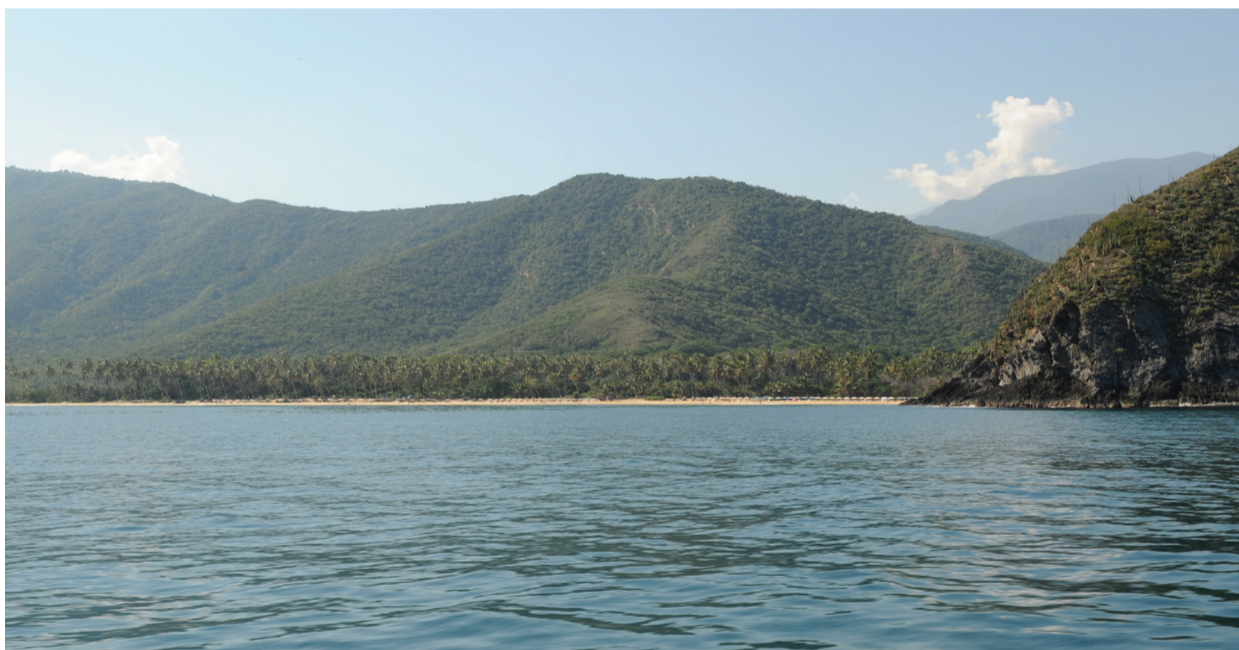
Bosque y cocotales en el litoral